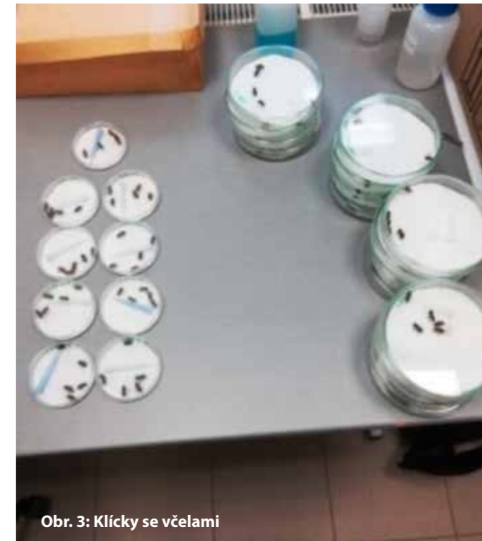
Obr. 3: Klíčky se včelami