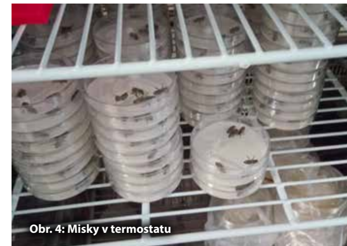
Obr. 4: Misky v termostatu