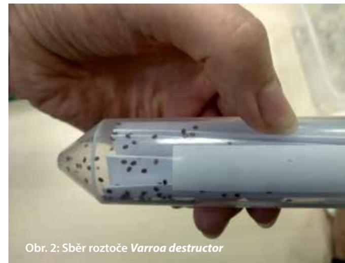
Obr. 2: Sběr roztoče Varroa destructor

Na základě hodnot z výše uvedených pokusů byly zvoleny bezpečné koncentrace rostlinných silic, které byly dále testovány na roztočích. Test s roztoči probíhal stejně jako testování silic na včelách s tím rozdílem, že ke včelám byli přidáni roztoči (Obr. 8). Následně se posuzovala mortalita včel i roztočů. První výsledky jsou již zpracovány a budou představeny na mezinárodní konferenci Agrosym 2021 v Sarajevu. Vy se na ně můžete těšit v jednom z našich dalších článků, které chystáme.