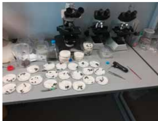
Obr. 8: Zakládání pokusu se včelami a roztoči