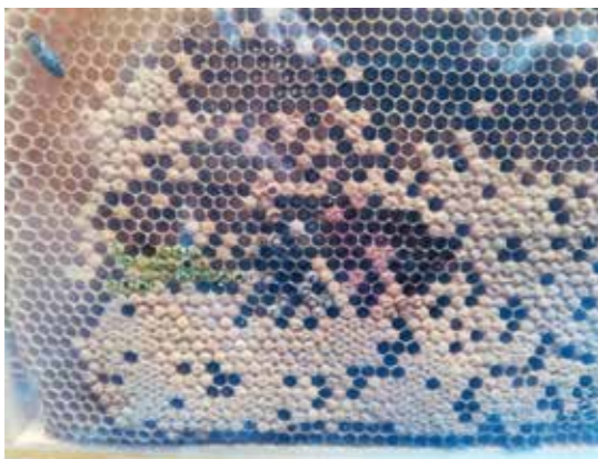
Obr. 6: Kontrola buněk s včelími larvičkami označených na průhledné folii