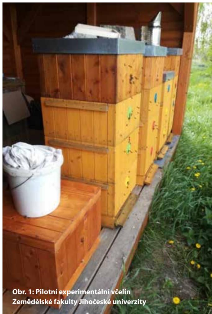
Obr. 1: Pilotní experimentální včelín Zemědělské fakulty Jihočeské univerzity

V letošním roce pokračoval výzkum v oblasti využití rostlinných silic pro zlepšení zdravotního stavu včelstev probíhající za spolupráce společnosti 1. Aromaterapeutická KH a.s. a Jihočeské univerzity. Výzkumné práce se uskutečnily na pilotním experimentálním včelíně Zemědělské fakulty Jihočeské univerzity v Českých Budějovicích (Obr. 1).